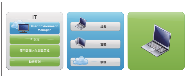
圖 1. 在任何裝置、位置或作業系統上提供一致且動態的應用程式與桌面平台經驗。